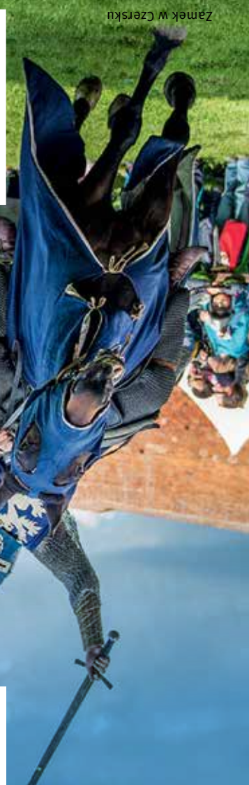
Zamek w Czersku