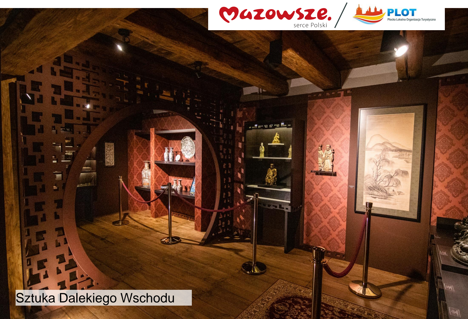
Sztuka Dalekiego Wschodu