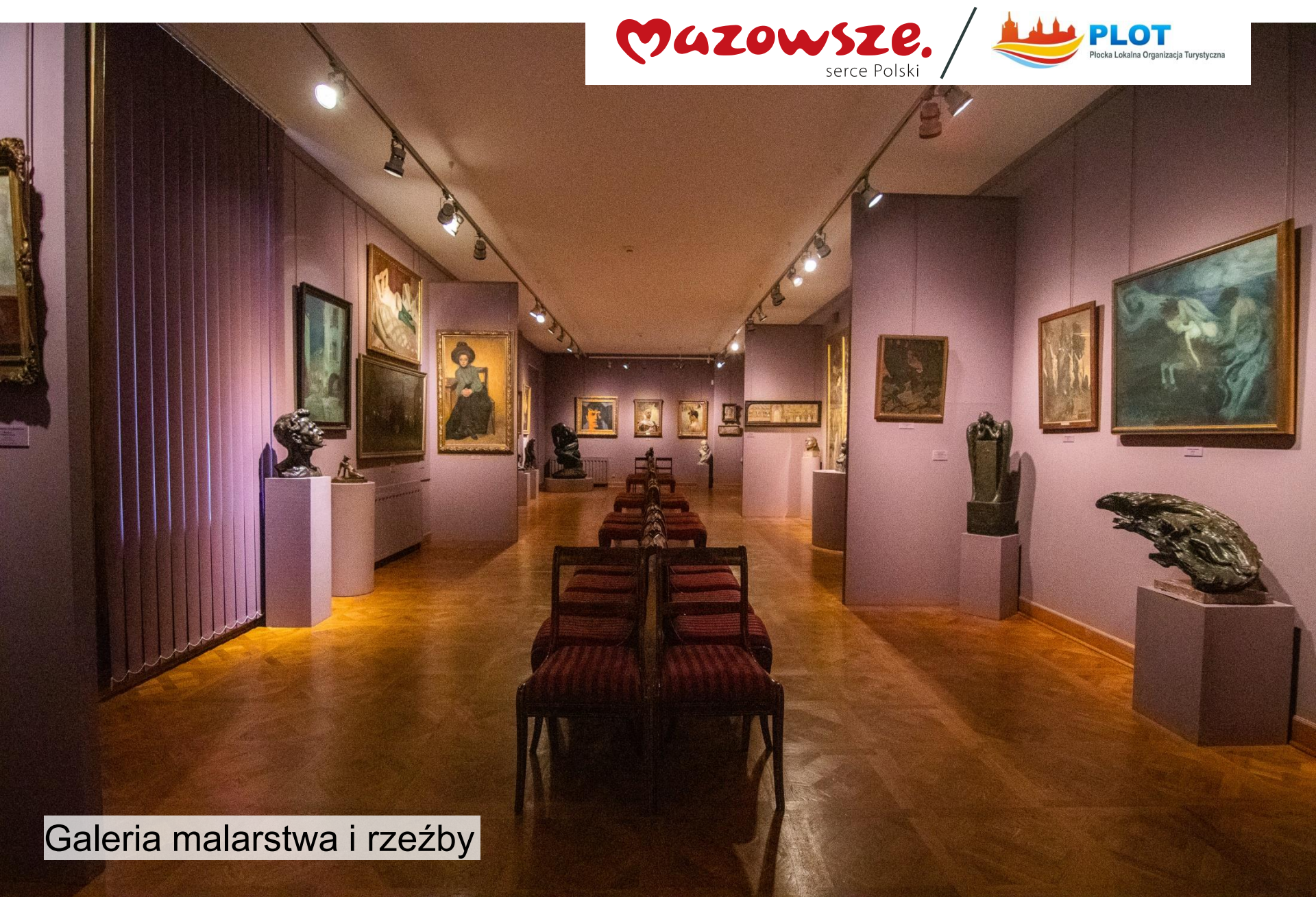
Galeria malarstwa i rzeźby