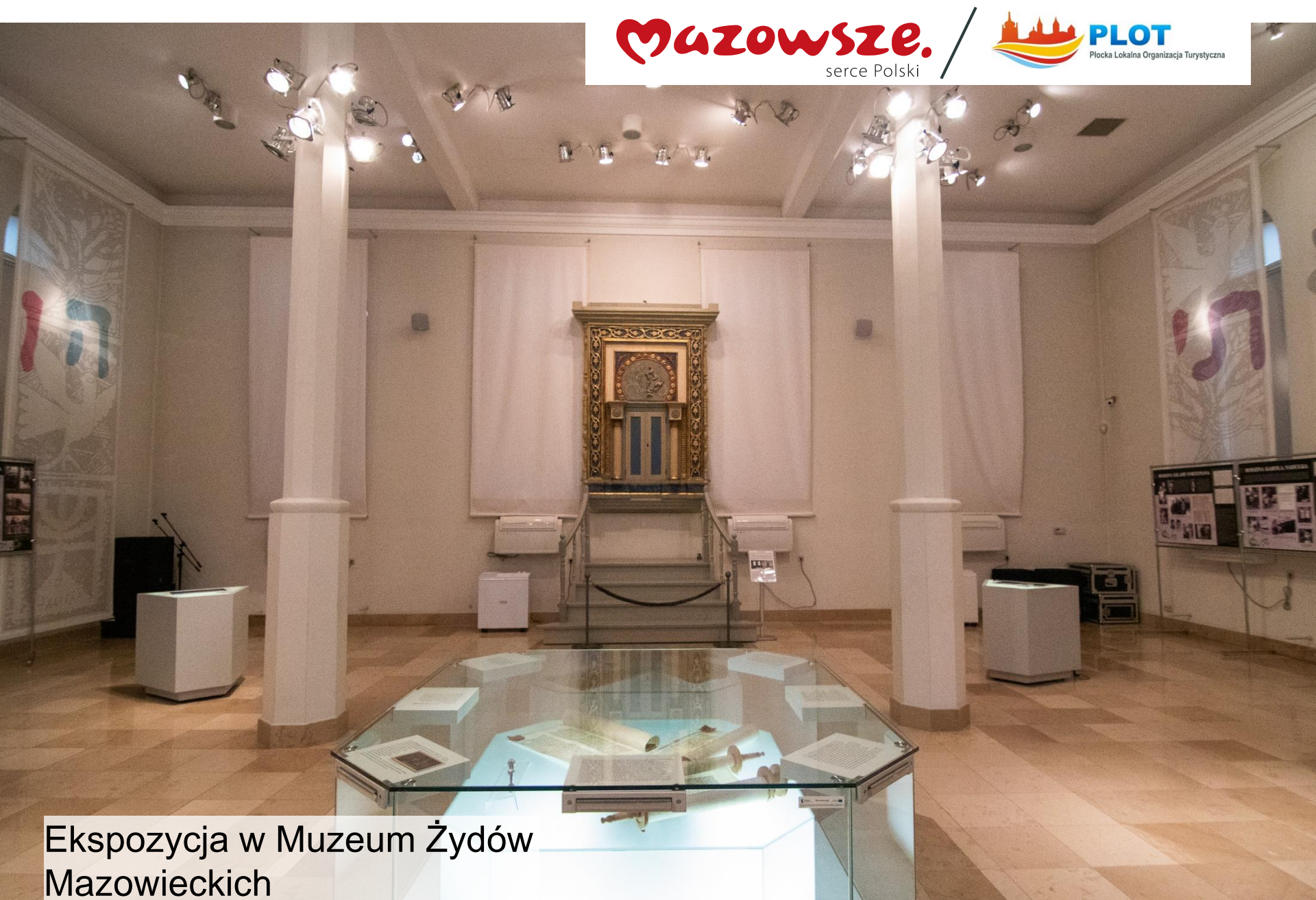
Ekspozycja w Muzeum Żydów Mazowieckich