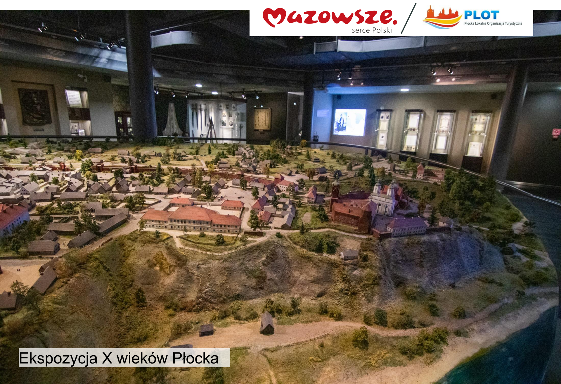
Ekspozycja X wieków Płocka