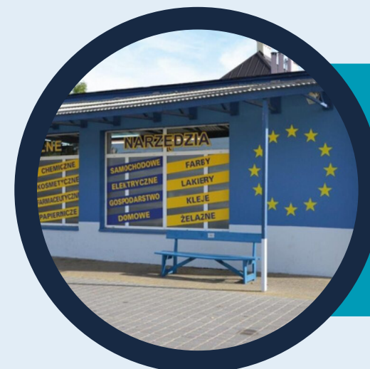
Jeruzal jak Nowa Zelandia