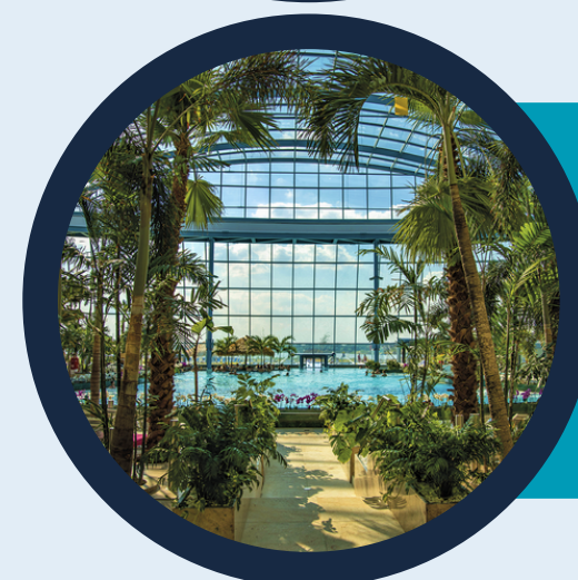
Suntago - największy park rozrywki w Europie