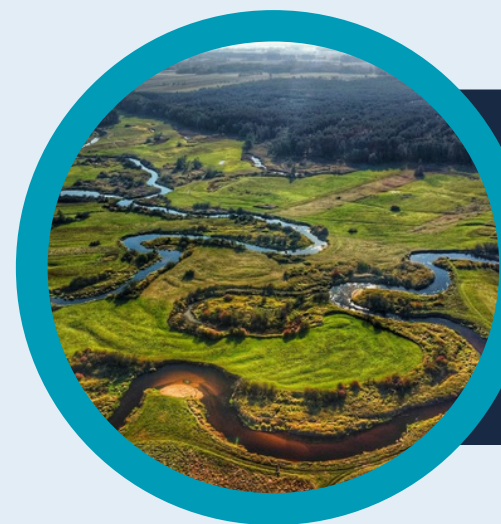
Nadbużański Park Krajobranowy