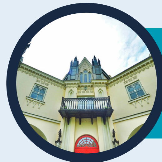
Pałac w Patrykozach