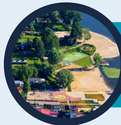
Plaża w Serocku i biała flota