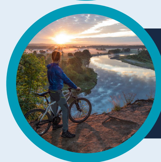
Podlaski Przełom Bugu